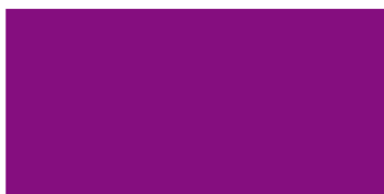
Szkło różowe RAL Design 340404